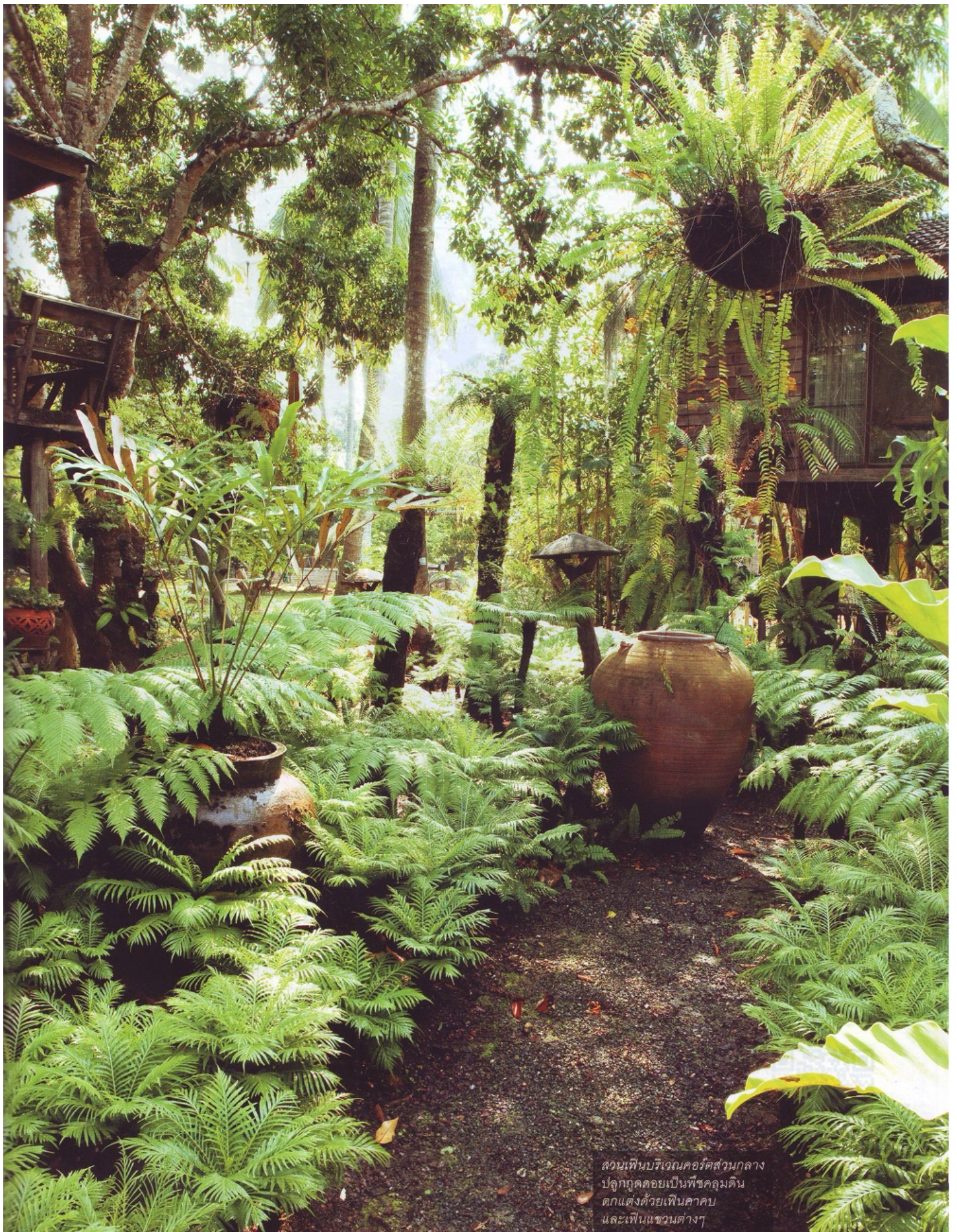
สวนเฟินบริเวณคอร์ติจวนกลาง ปลูกทดดยเป็นพืชคลุมดิน ตกแต่งด้วยเฟินคาบ และเฟินแขวนต่างๆ