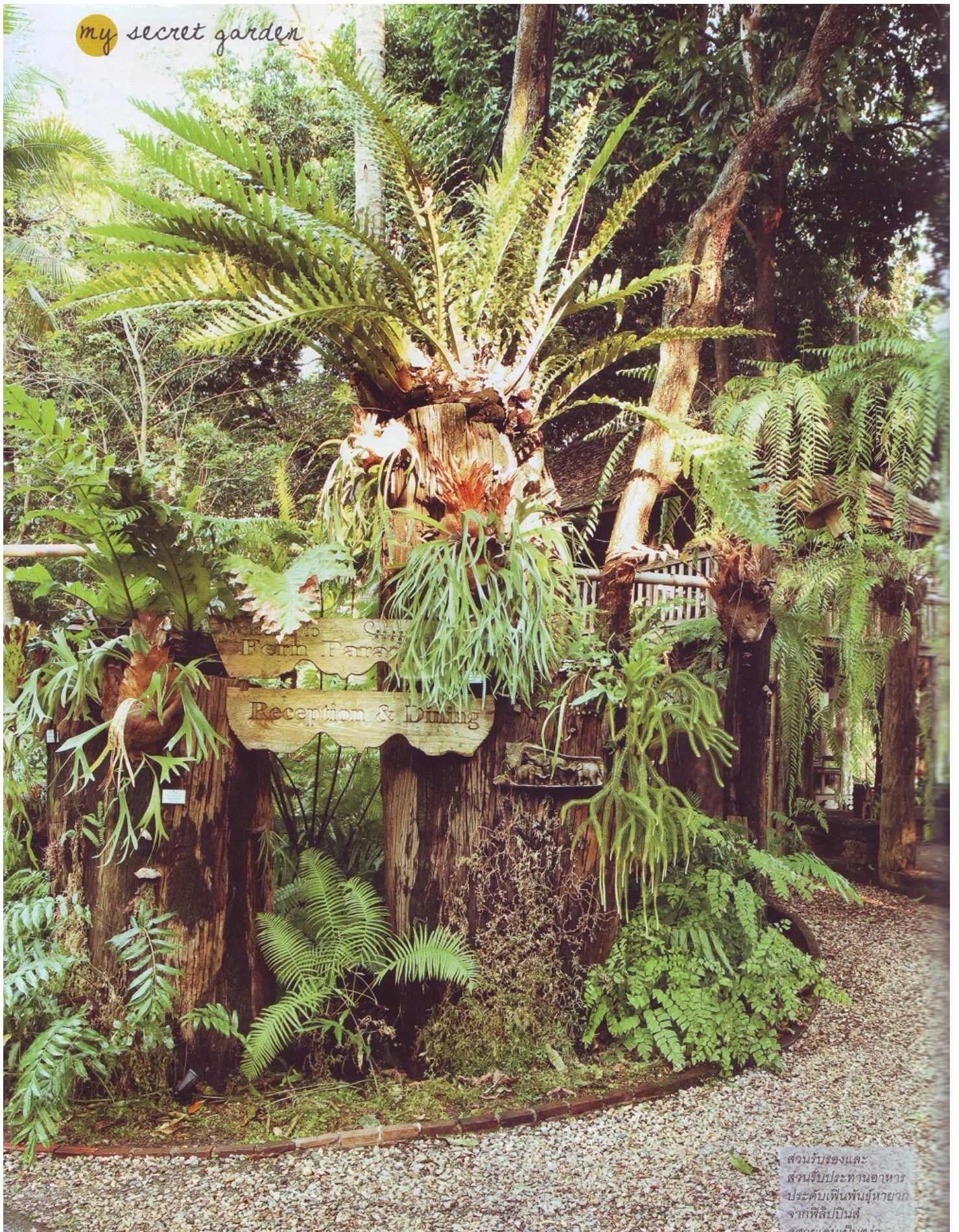
สวนรับรองและ ส่วนรับประทานอาหาร ประดับเฟิร์นพันธุ์หายาก จากฟิลิปปินส์ จัดโดยคุณเป็บฮวด