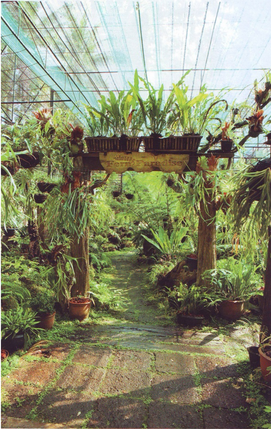
สวนเฟินในกรีนเฮ้าส์ ที่คุณนิวัติเฟื้อาทะเลนุดนอม เป็นอย่างดี