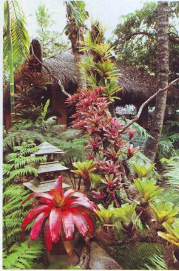
บริเวณเรือนพักตกแต่งด้วยเฟินชนิดต่างๆ และ ใช้วัสดุพื้นบ้านที่แสดงถึงวัฒนธรรมของหนองข้าว

นอกจากเฟินหลากหลายสายพันธุ์แล้ว ยังมีสับปะรดสีให้ชมด้วย