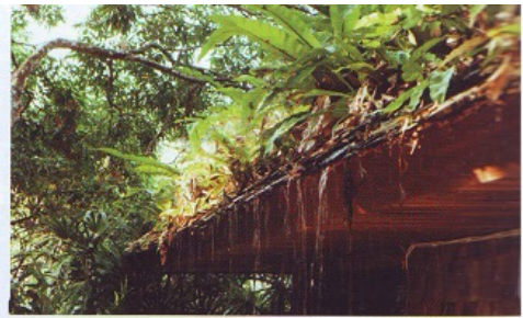
เฟินที่กระจายพันธุ์ขึ้นเองตามธรรมชาติ บนหลังคาที่มีสภาพแวดล้อมเหมาะสม