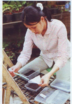
หนึ่งในขั้นตอนการเพาะสปอร์ โดยการ โรยสปอร์ลงในกล่องพลาสติกที่บรรจุพีทมอสส์ ซึ่งเป็นตัวกักเก็บความชื้น