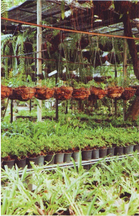
โรงเพาะชำในอีกส่วนหนึ่ง ใช้อนุบาลเฟินที่เริ่มโตขึ้นอีกระดับ

นอกจากเฟินหลากหลายสายพันธุ์แล้ว ยังมีสับปะรดสีให้ชมด้วย